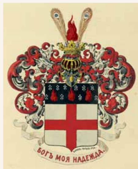
Герб дворянского рода Цуриковых. 1880 год.

Успенский храм с двумя приделами в трапезной был заложен 25 июля 1864 года с благословения митрополита Московского Филарета (Дроздова), а спустя всего четыре года готов к освящению, которое и состоялось в воскресный день 29 сентября 1868 года. Белоснежный храм на фоне осеннего убранства и голубого неба выглядел чудом Божиим. Очевидцы отмечали, что он «по изяществу отделки не имеет