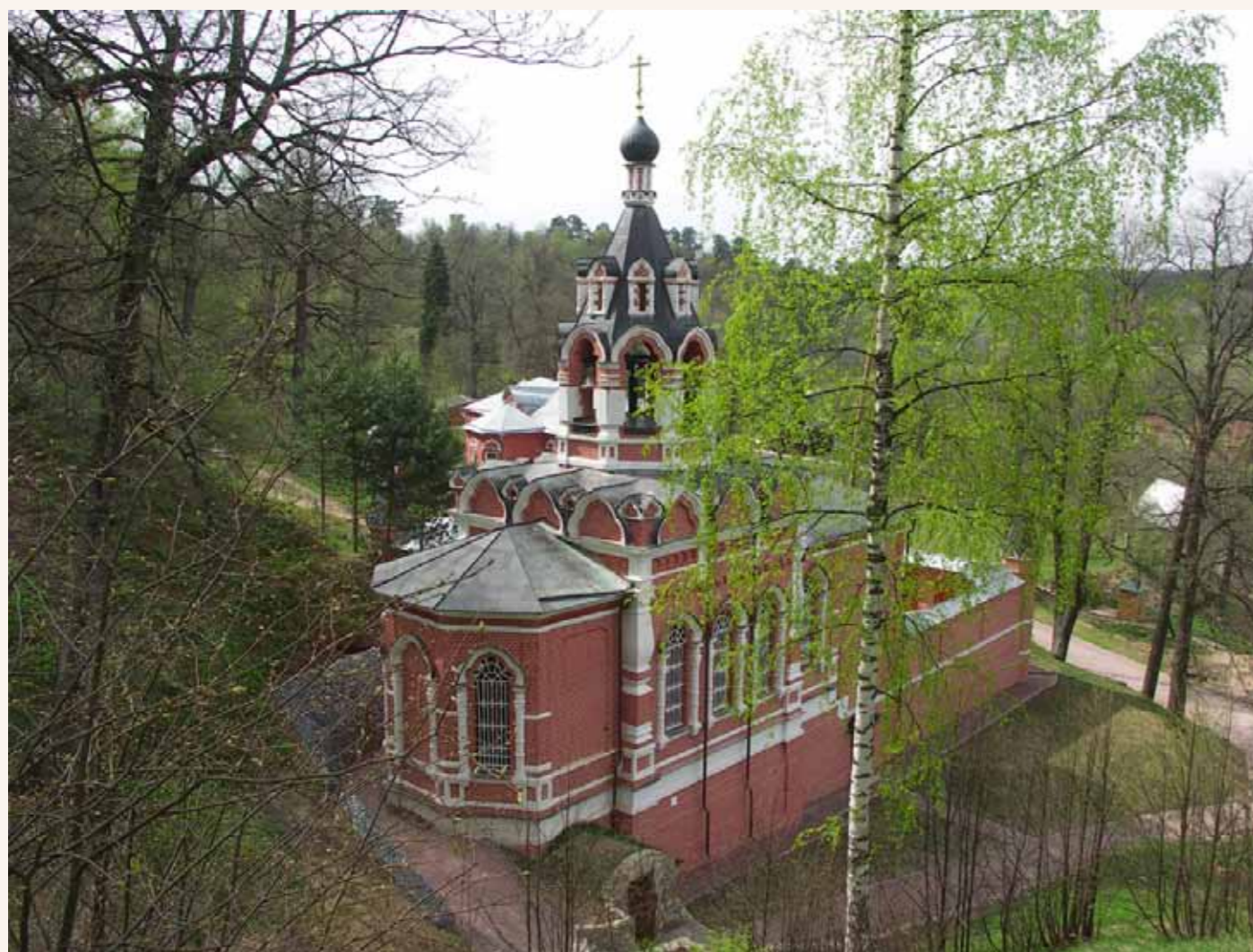
Саввинский скит близ Звенигорода. 2008 год.

Такие крупные и многочисленные благодеяния Цурикова в пользу храмов и монастырей не могли оставаться