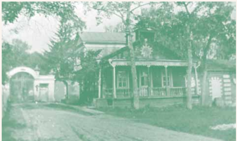
Дом основателя фабрики у главных ворот. Начало XX века

молебен и просил сестёр молиться о поимке злодея. Уж неизвестно как, но через пару дней злоумышленник был пойман и предстал перед Цуриковым.