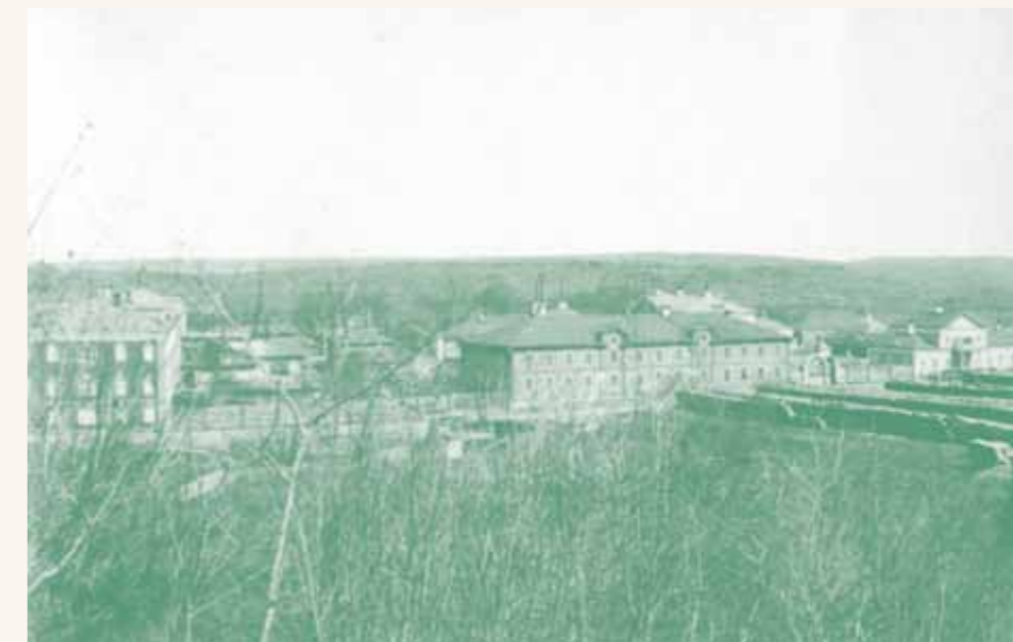
Ивановская суконная фабрика. Середина 1890-х годов