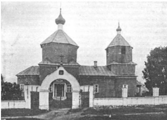
Храм Преображения Господня в селе Никулино. Фото начала XX века из книги «Спутник по Московско-Виндавской железной дороге».

До наших дней среди документов Московской Духовной Консистории в архиве ЦИАМ сохранились некоторые сведения о ремонт-